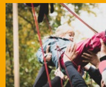
Es geht hoch hinaus.