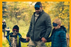
Führen und Folgen – ob Groß, ob Klein