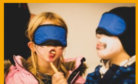
Mutprobe als Blindverkostung.