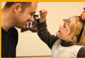
Vorbereitung für das perfekte Halloween Wochenende.