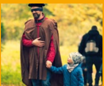
Ich zeig dir meine Welt.

Mit riesengroßer Freude und auch ein klein wenig Aufregung begann das diesjährige Vater-Kind-Wochenende am 30. Oktober. Schließlich lautete das Motto passend zu Halloween „Hotel Transilvanien“ und es galt Mut zu beweisen, um den verborgenen Schatz zu finden. Nach den für Familien so anstrengenden letzten Monaten erlebten 11 Väter mit ihren Kindern eine wundervolle Auszeit von der sie noch lange zehren werden.