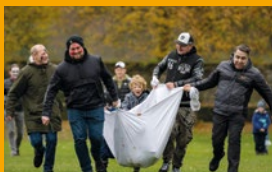
Gemeinsam sind wir stark.