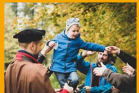
Wir sind für einander da.