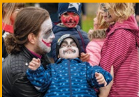
Vertrau mir- ich halte dich.